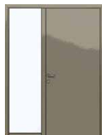
CAS 3 1 tierce fixe