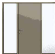
CAS 4 2 tierces fixes