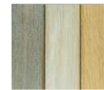
Huilée intérieur (sur chêne uniquement)