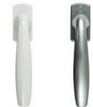
Poignée de fenêtre New-York (en standard)