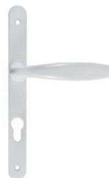
Poignée de porte-fenêtre New-York (en standard)